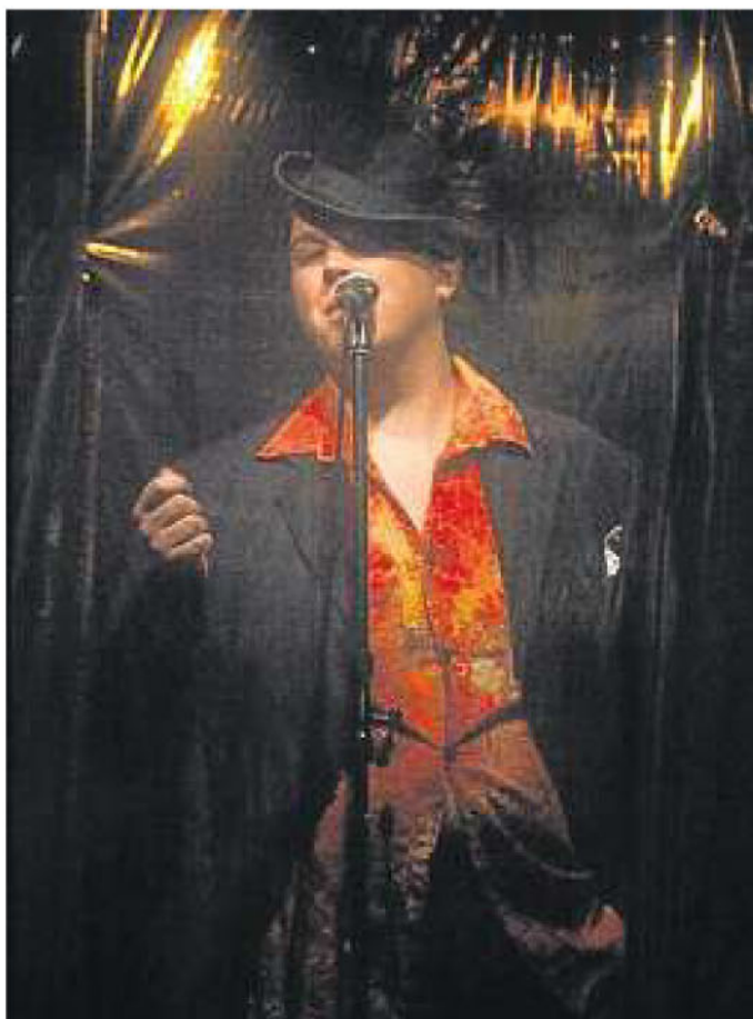
Seelenstriptease in reflektierenden Chatrooms.

Akribisch wurden erkennbare Charaktere mit fest umrissener Persönlichkeit entwickelt, die in ihrem Bewusstsein gefangen sind. Auf der anderen Seite gibt es Fantasiefiguren wie den Diktator, die Hexe, ein rosa Hase oder den Steinbeißer, die der Geschichte absurde und komische Wendungen verleihen. Die über dreistündige Vorstellung ohne Pause packt einen von der ersten bis zur letzten Minute, ohne dass auffällt, dass das Szenario aus der Improvisation